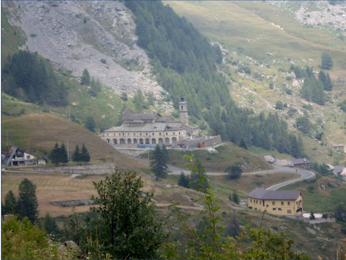
Figura 1. Il monastero di San Magno, a Castelmagno (Cuneo).