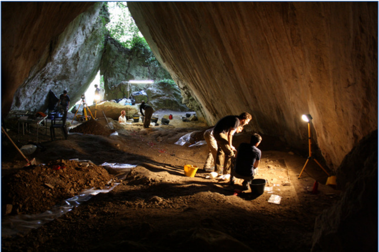
Fig. 1 – 2015 excavation at Arma Veirana (Erli, Savona).

While these different projects are still at their beginnings, several noteworthy data have already emerged. Beginning with the oldest assemblage, a small, flat quartzite biface has been identified in the lithic collection from Monte Albareo, located close to Grotta della Madonna dell'Arma, which was recovered during the excavation of a trench dug to install a pipeline (Lumley et alii 2008) (fig. 2). It is the only artifact of that type currently known from Liguria and it resembles those from Level UA 25 from Grotte du Lazaret, which dates to ca. 160ky BP (Lumley 2004). The heavily laminar assemblage from Via San Francesco, in Sanremo, also potentially dates to an early phase of the